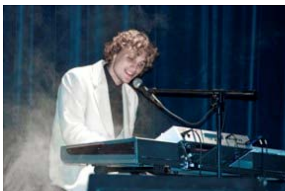
Grand Prix VI OFPR'2009