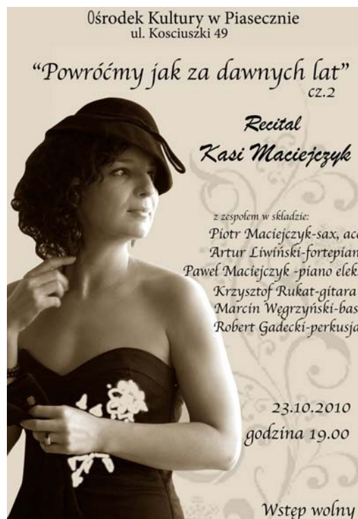
Złoty Liść Retro za najlepszy debiut 2010

Piaseczno, ul. Kościuszki 49 www.kulturalni.pl